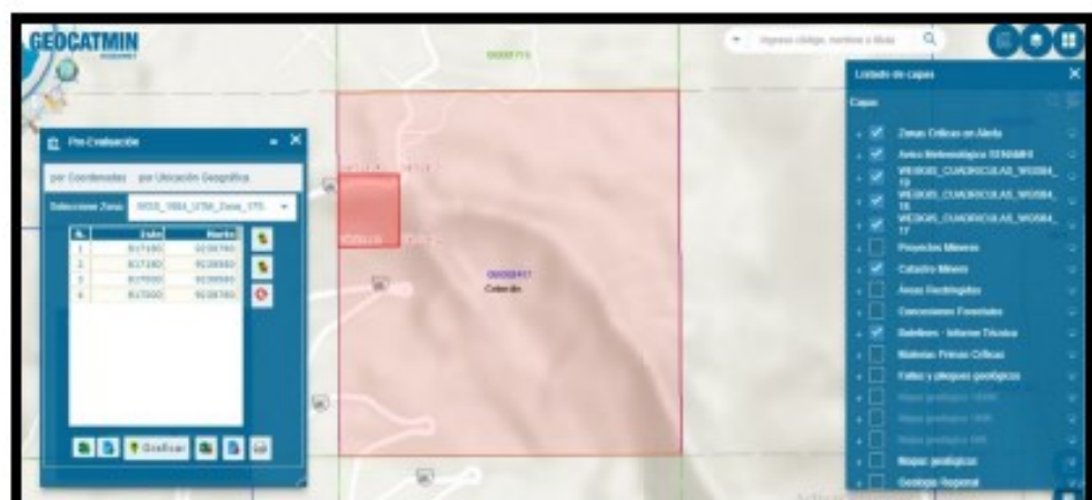
IMAGEN N° 1: Ubicación del área actividad minera en el derecho minero