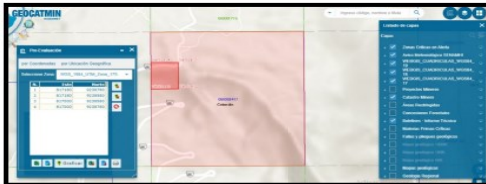
IMAGEN N° 1: Ubicación del área actividad minera en el derecho minero

4.10. Con relación al CICLO DE MINADO se detalla lo siguiente: