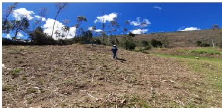
Fotografía Nº 03: Como se puede evidenciar en la coordenada UTM sistema WGS84 zona 17S, E:781232 N:9252922, declarada por el administrado Inversiones las Lajas del Milagro S.A.C, unicamente se evidencia pastisales mas no el componente almacen de herramientas y/o el cierre del mismo, como a declarado en su IGAFOM aspecto correctivo de cierre.