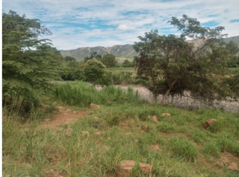
Fotografía N° 01: Punto declarado por el titular Sra. Quispe Hilario Pierina Beatriz con coordenadas Este: 745320 Norte: 9407968