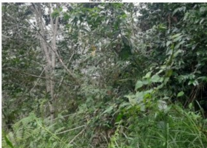
Fotografía N° 02: Punto declarado por el titular Córdova Gaona Grimaldo, no se evidencia actividad minera.