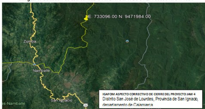
Imagen 1: Ubicación de coordenada UTM DATUM WGS 84 E: 733096 N: 9471984