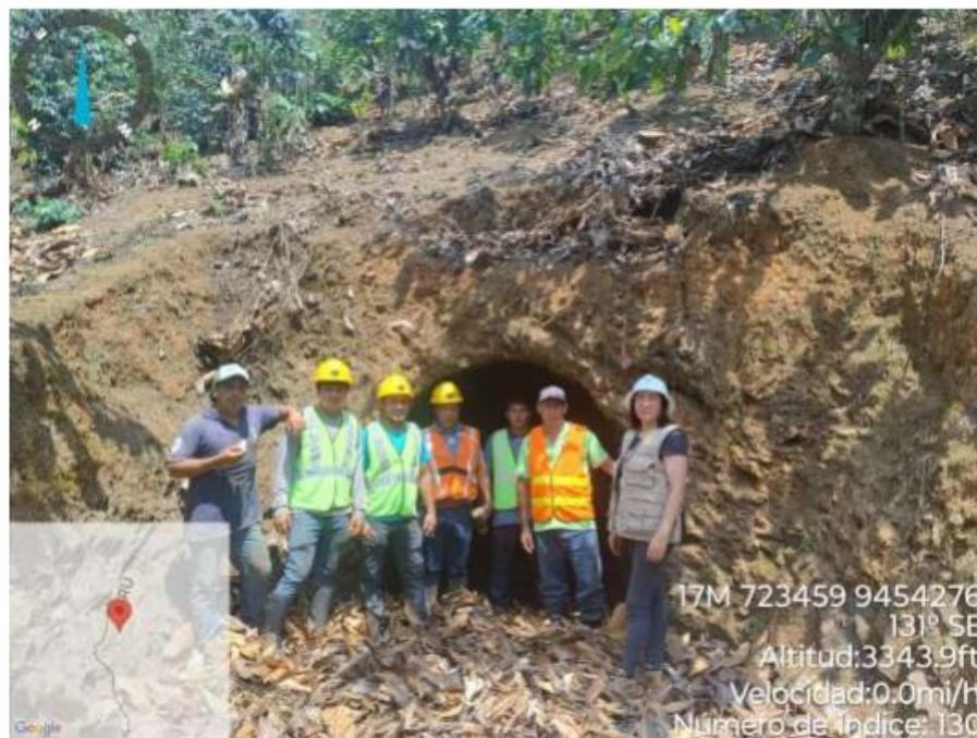
Frente de trabajo Proyectoado. P-03