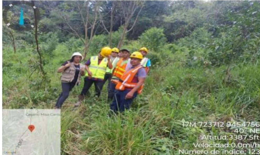
Frente de trabajo Proyectoado. P-02